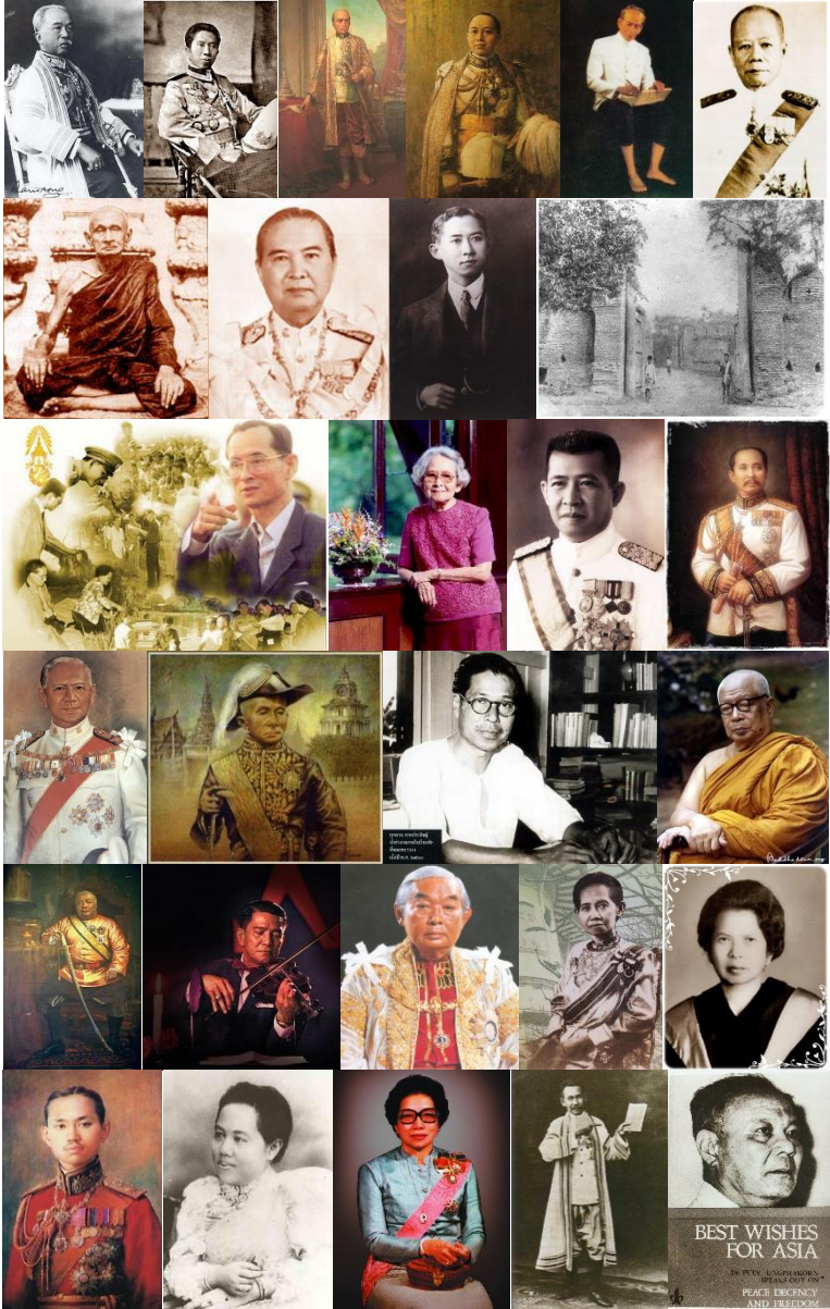
BEST WISHES FOR ASIA BY THE ASSOCIATION OF PEACE DEFICENCY AND FEELING