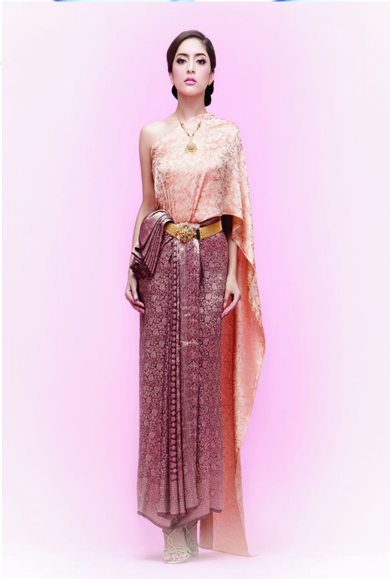
ชุดไทยจักรี