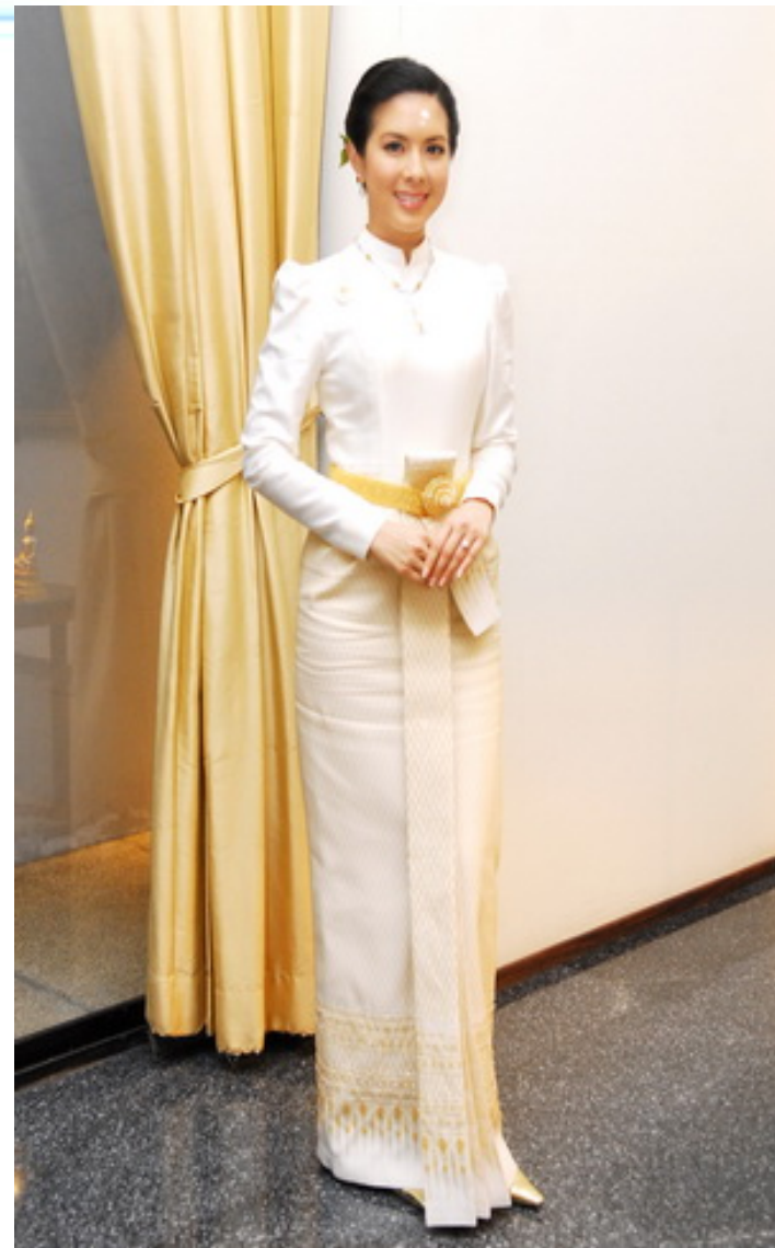
ชุดไทยบรมพิมาน