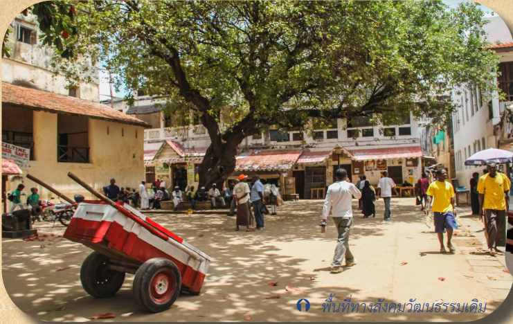
พื้นที่ทางสังคมวัฒนธรรมเดิม