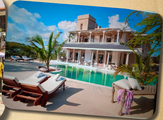
โรงแรมก่อสร้างใหม่ติดชายหาด

หลังจากที่เมืองเก่าลามูได้ขึ้นเป็นมรดกโลกในปี 2001 แล้ว ก็มีกิจกรรมและการเปลี่ยนแปลงเกิดขึ้นหลายด้านที่พิพิธภัณฑสถานแห่งชาติของลามูไม่อาจจะเข้าไปห้ามปรามป้องกันได้ การเปลี่ยนแปลงส่งผลกระทบต่อบูรณภาพและความแท้จริงของเนื้อเมืองและจิตวิญญาณทางวัฒนธรรมของเมือง โดยเฉพาะการซื้อขายที่ดินบนเกาะทั้งในบริเวณเขตมรดกโลก เขตพื้นที่กันชน และพื้นที่บนเกาะอื่น ๆ ใกล้เคียงกับลามู ส่วนใหญ่ผู้ซื้อที่ดินเป็นนักลงทุนชาวต่างชาติผู้มีทุนมาปรับเปลี่ยนอาคารสถานที่ให้รับใช้การท่องเที่ยวได้มีประสิทธิภาพมากขึ้น