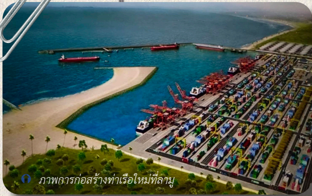
ภาพการก่อสร้างท่าเรือใหม่ที่ลามู