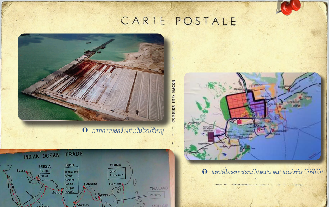
ภาพการก่อสร้างท่าเรือใหม่ที่ลามู