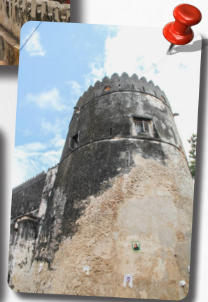
ป้อมลามู